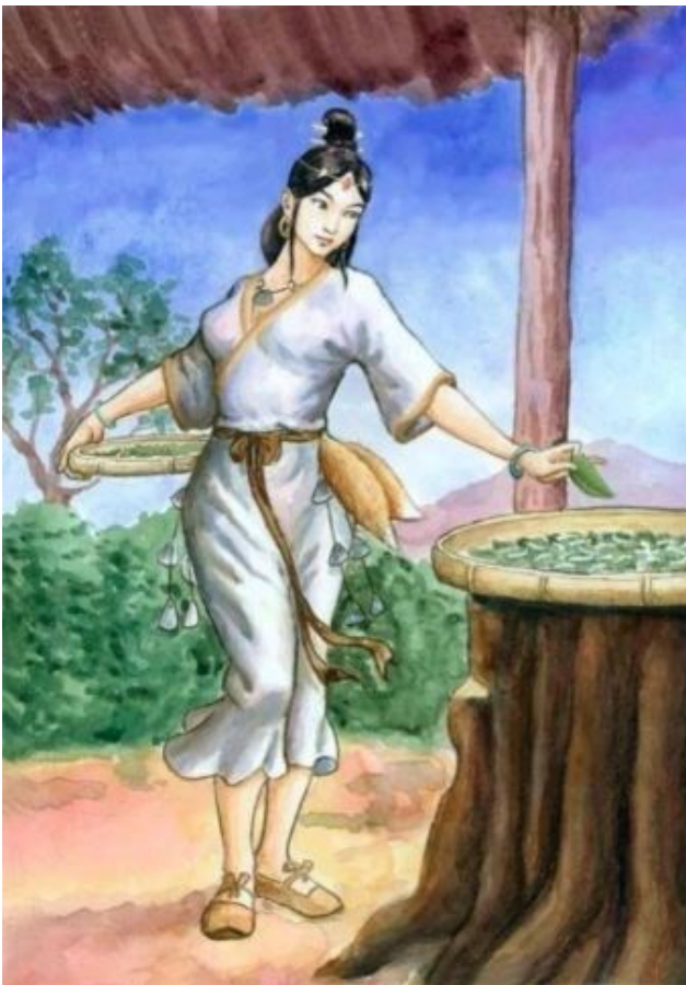
LEI ZU, DEUSA DA SEDA

Tal aconteceu quando LEI ZU, concubina do primeiro imperador chinês, tomava chá e lhe caiu na chávena um casulo de onde se desprenderam uns filamentos suaves, fortes e longos que podiam ser tecidos.